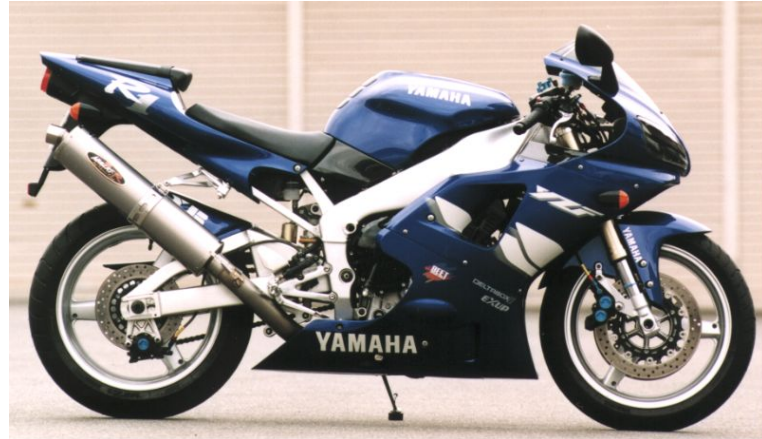
NASSERT-R スリップオン TI/TI YZF-R1